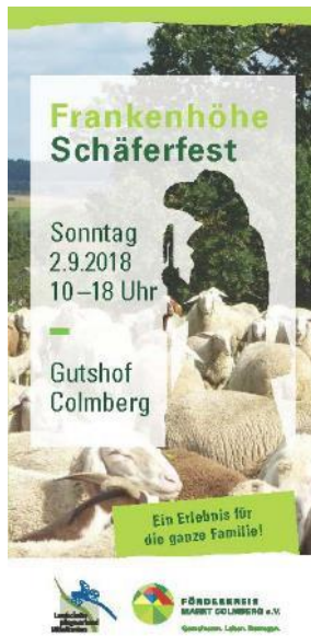
Infolyer zum Schäferfest