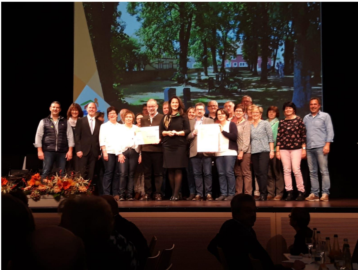
Überreichung der Urkunde durch Landwirtschaftsministerin Michaela Kaniber in Veitshöchheim

Nach 2 Mal Gold auf Kreis- und Bezirksebene mussten wir uns diesmal mit Bronze zufriedengeben. Aber auch darauf können wir stolz sein, schließlich gehört Binzwangen damit zu den 15 besten Dörfern von 237, die am Wettbewerb teilgenommen haben . Entsprechend frohgestimmt sind dann auch am 24.11.2018 zur Abschlussveranstaltung nach Veitshöchheim gefahren.