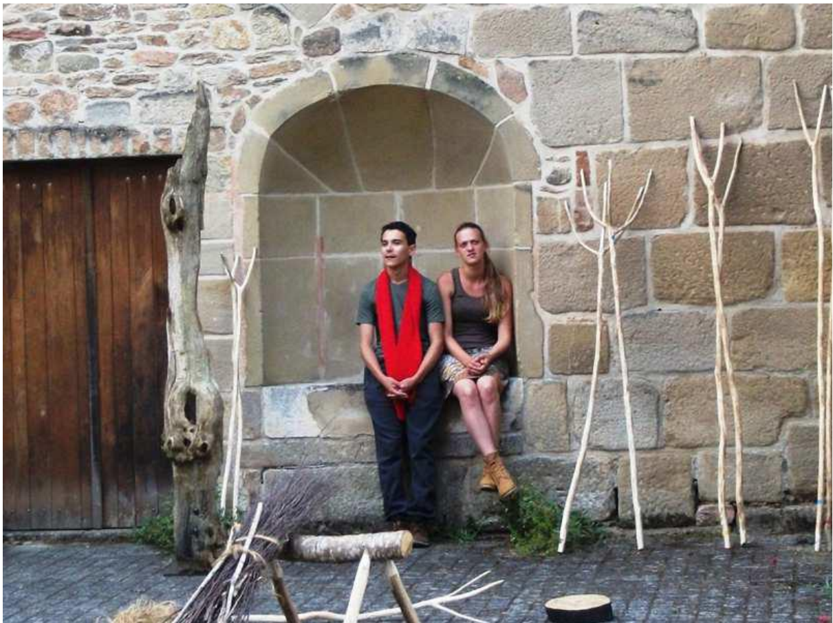
Abb. : Theateraufführung im Klostergarten „Gretel und Hansel“

Nach dem Frühstück, der Verteilung in die Gastfamilien / Zimmervergabe, trafen wir uns zu einem gemeinsamen Mittagessen mit den Künstlern der Kulturtage. Während die Golfer ein Turnier austrugen, besuchten die anderen eine Theateraufführung im Klostergarten – gut – manche Jugendliche aus Colmburg waren lieber mit gleichaltrigen zusammen, ein sehr guter Weg, sich besser kennenzulernen.