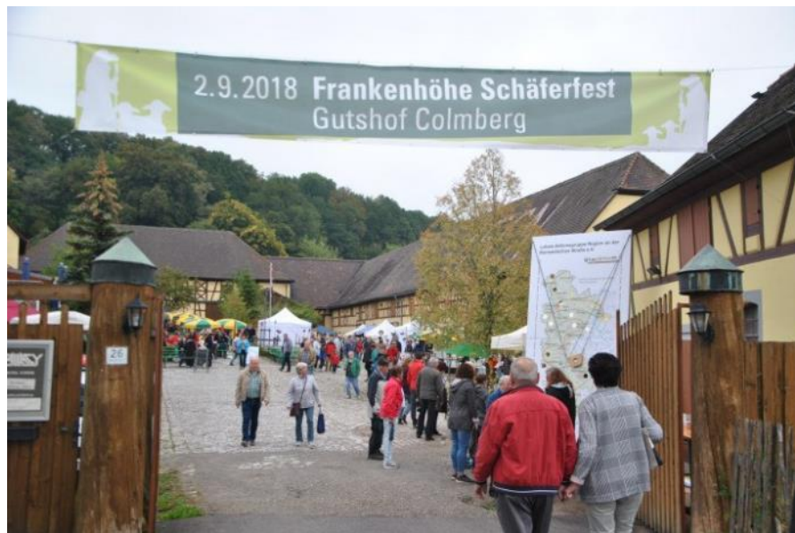
Passendes Ambiente am Gutshof in Colmberg für das Schäferfest

Ein vielfältiges Begleitprogramm rund um das Thema Schaf rundete das Programm ab: Schafschurvorführungen, Hütevorführungen, Rassenschau mit Schafen, Ziegen und Rindern, Rotenburger Schäfertanzgruppe und Kinderprogramm.